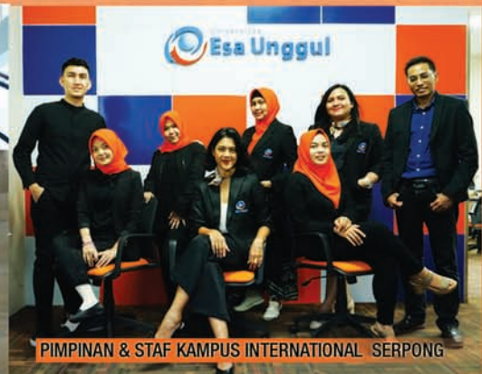
PIMPINAN & STAF KAMPUS INTERNATIONAL SERPONG