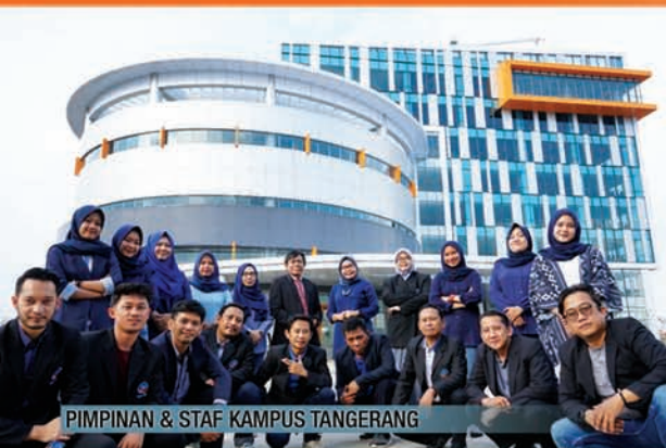
PIMPINAN & STAF KAMPUS TANGERANG