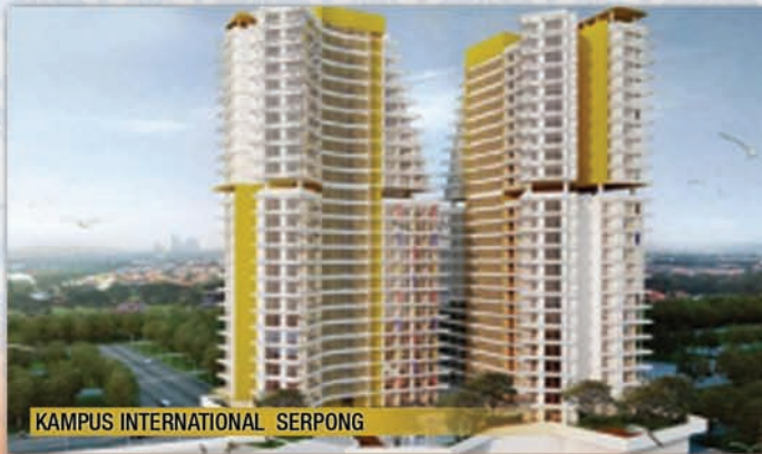
KAMPUS INTERNATIONAL SERPONG