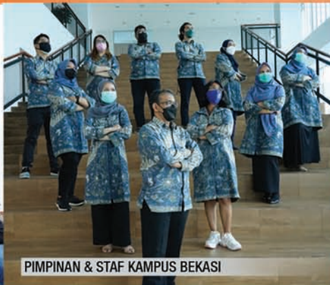
PIMPINAN & STAF KAMPUS BEKASI